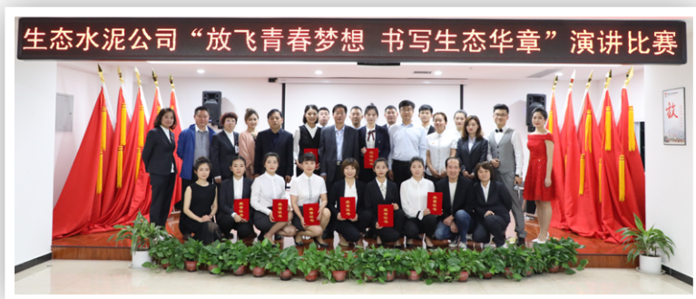
“放飞青春梦想 书写生态华章”主题演讲比赛合影