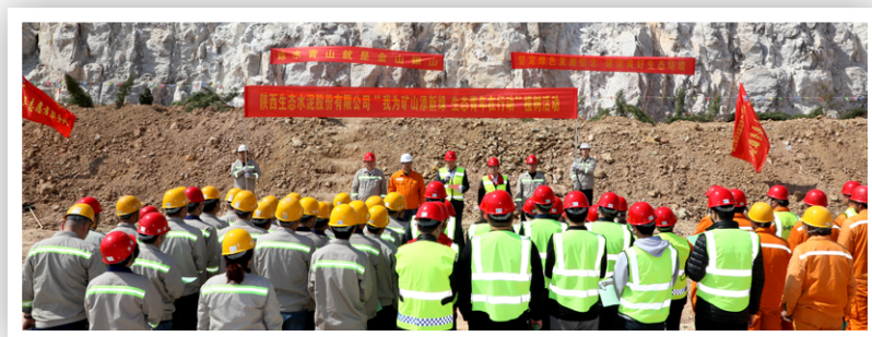
“我为矿山添新绿，生态青年在行动”活动启动仪式