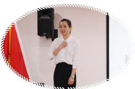
辛莉 《一个小小开票员的诗和远方》