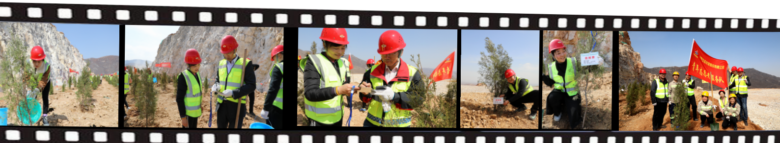
用心浇灌 愿她守护青山