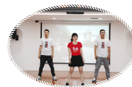
歌曲《我的未来不是梦》