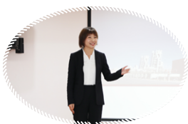
冯程 《小岗位大梦想》