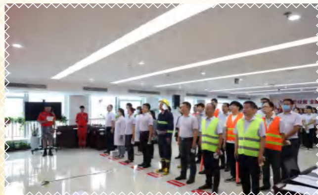
分组速集结，演练一触即发