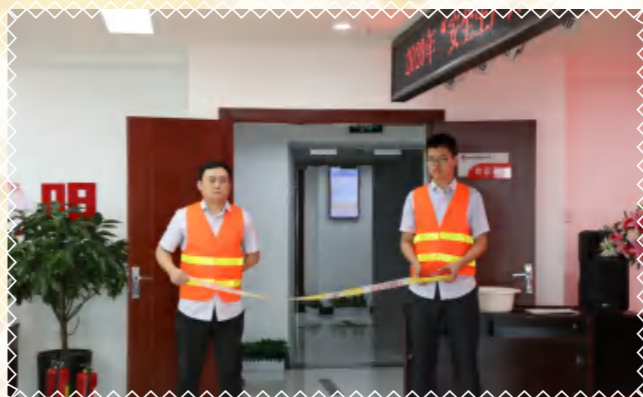
拉紧警戒带，疏散不容忽视