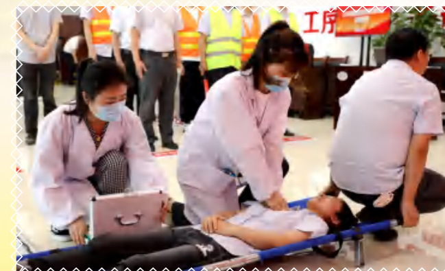
现场医疗救护，抢救于瞬间