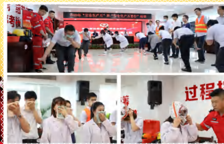
消防自救增技能，挑战急速“秒行动”