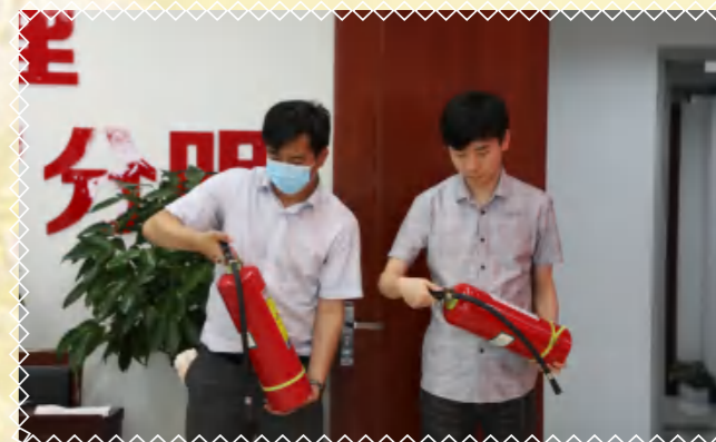
检查灭火器，紧急制动操作