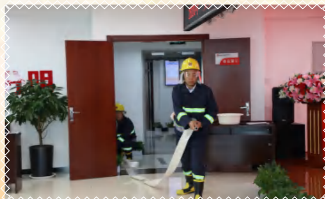
启动消防栓，隔绝助燃物品