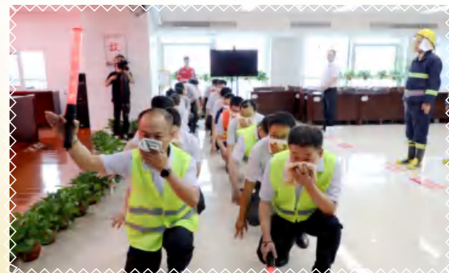
发现着火点，逃生依次有序